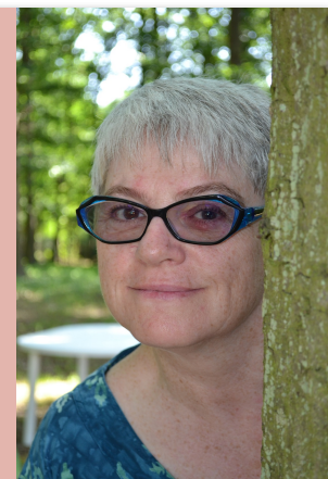
Hélène, ta créatrice

Toi, 10 ans déjà, Toi que j'ai désiré, Toi que j'ai élaboré, Toi qui as vu le jour après plus d'un an passé, Toi qui as mobilisé, Toi qui es fêté au printemps, Toi qui as rapproché, Toi qui es familier, Toi qui m'as fait connaître de belles âmes au fil des ans, Toi, oui toi, qui es entré dans mon histoire, avec nos compagnons, demeurons ensemble encore des années durant. Toi, oui toi, nommé bric-à-brac.